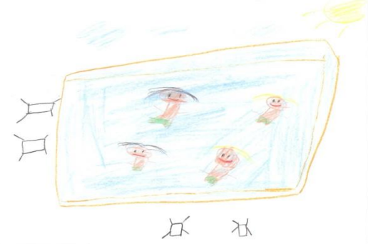
Serdar Ali YARDIMCI 7,6 YAŞ

güvendiği bir yetişkine söylemekte tereddüt yaşamaması gerektiğini vurgulayın.